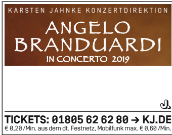
1-spaltig (45mm x 35mm)