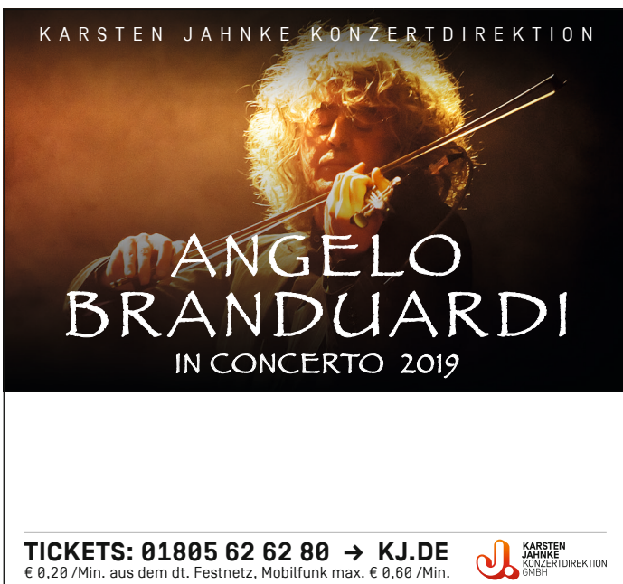
2-spaltig (91,5mm x 85mm)