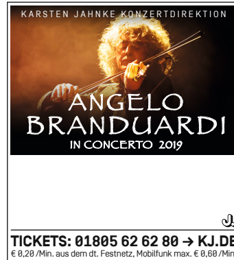
1-spaltig (45mm x 50mm)